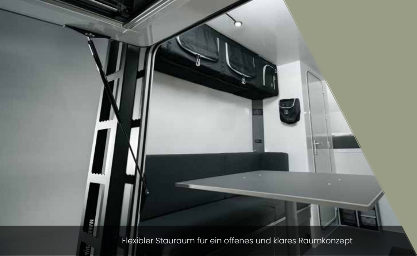
Flexibler Stauraum für ein offenes und klares Raumkonzept