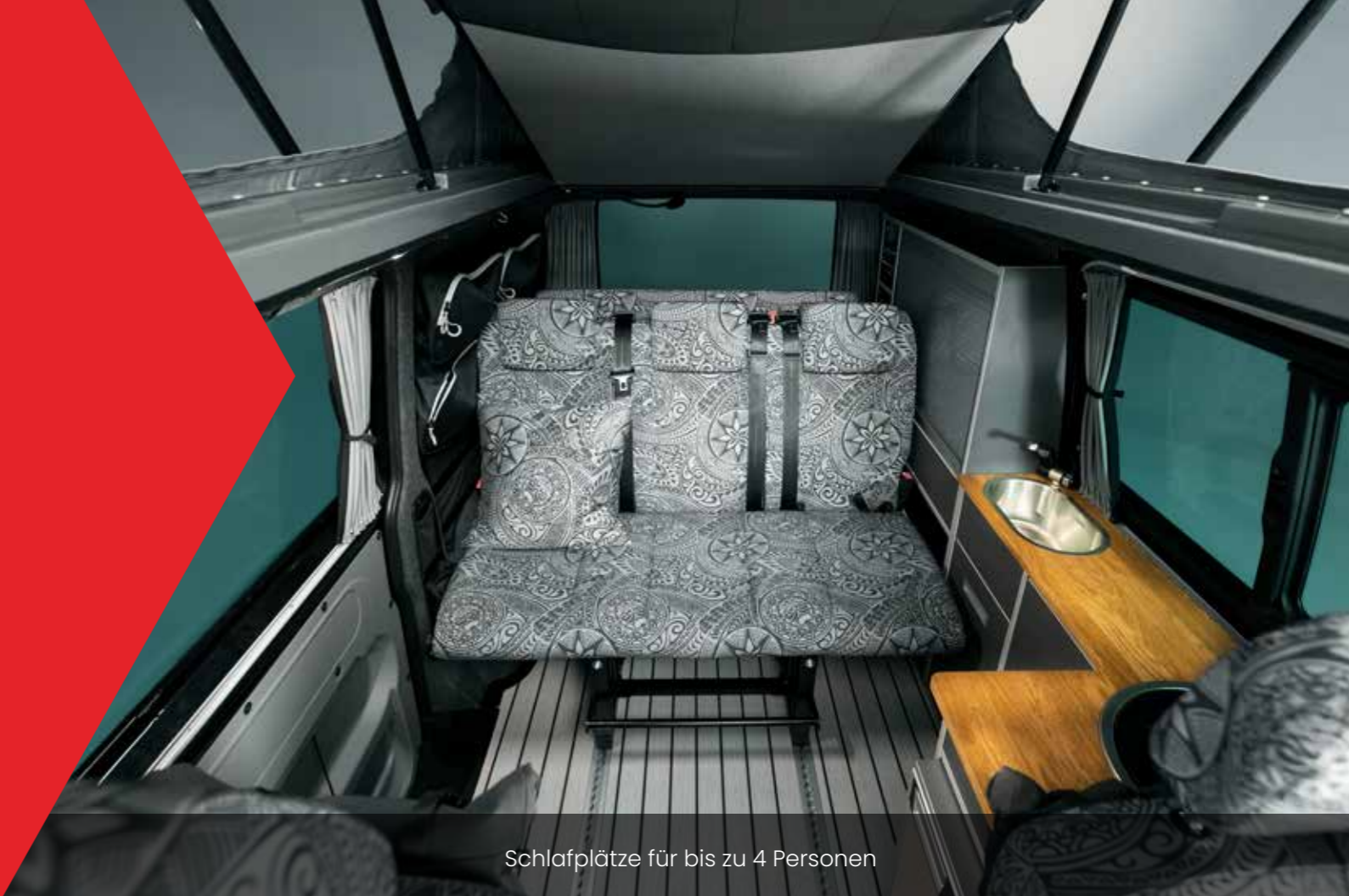
Schlafplätze für bis zu 4 Personen