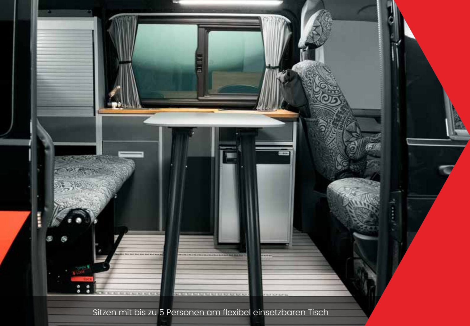
Sitzen mit bis zu 5 Personen am flexibel einsetzbaren Tisch