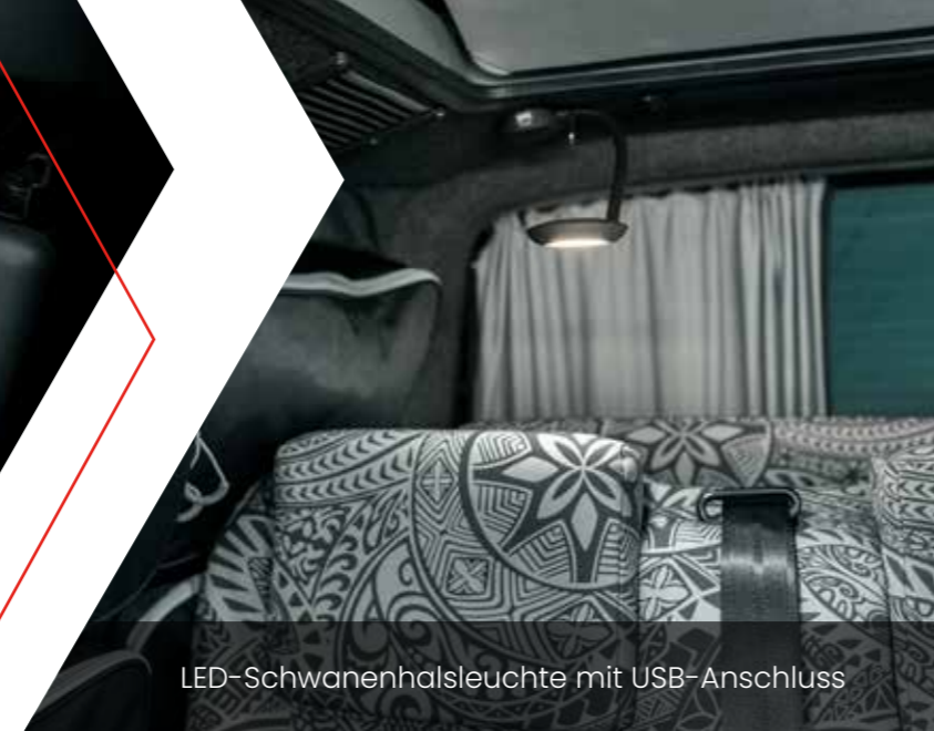
LED-Schwanenhalsleuchte mit USB-Anschluss