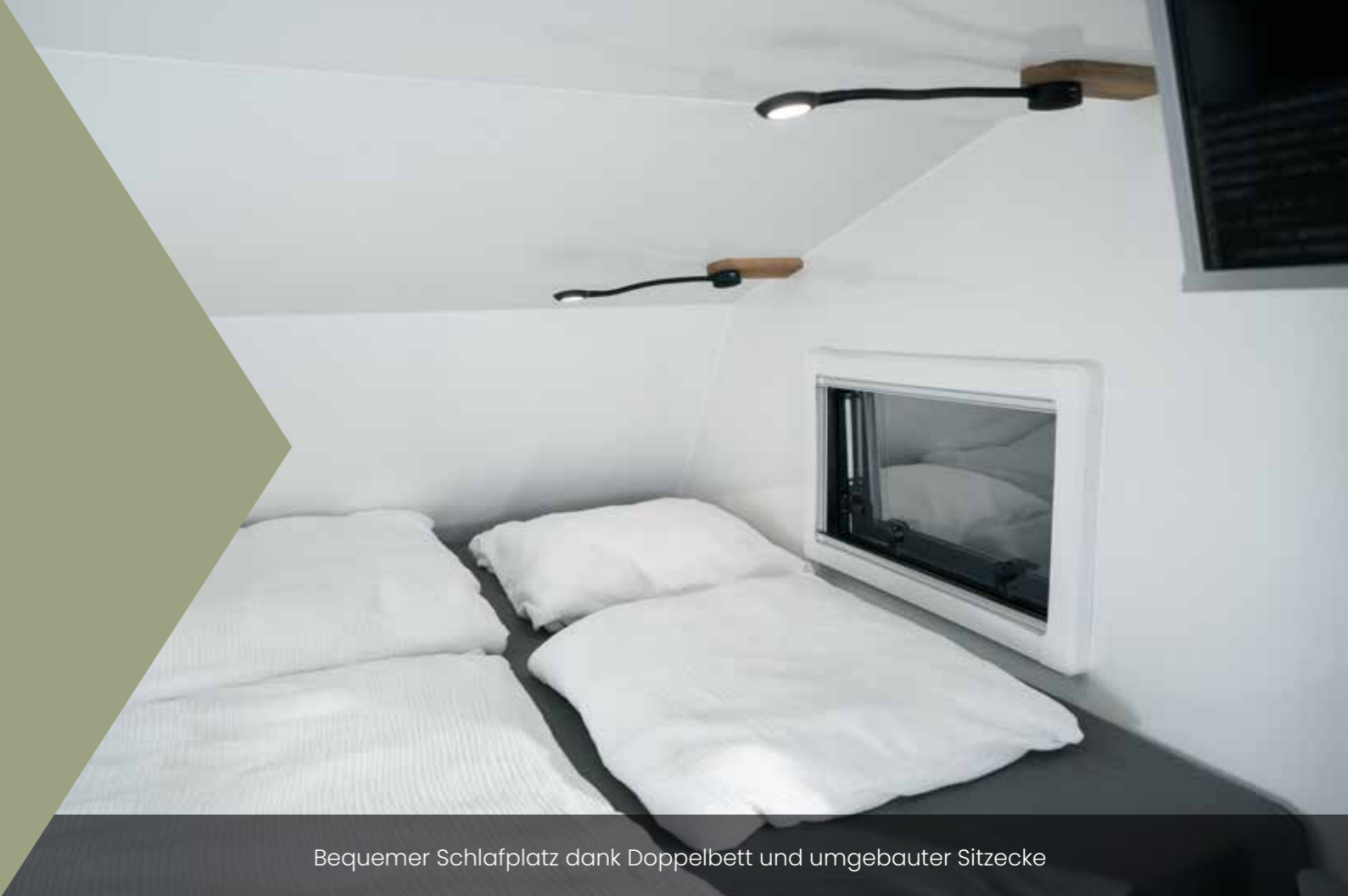
Bequemer Schlafplatz dank Doppelbett und umgebauter Sitzecke