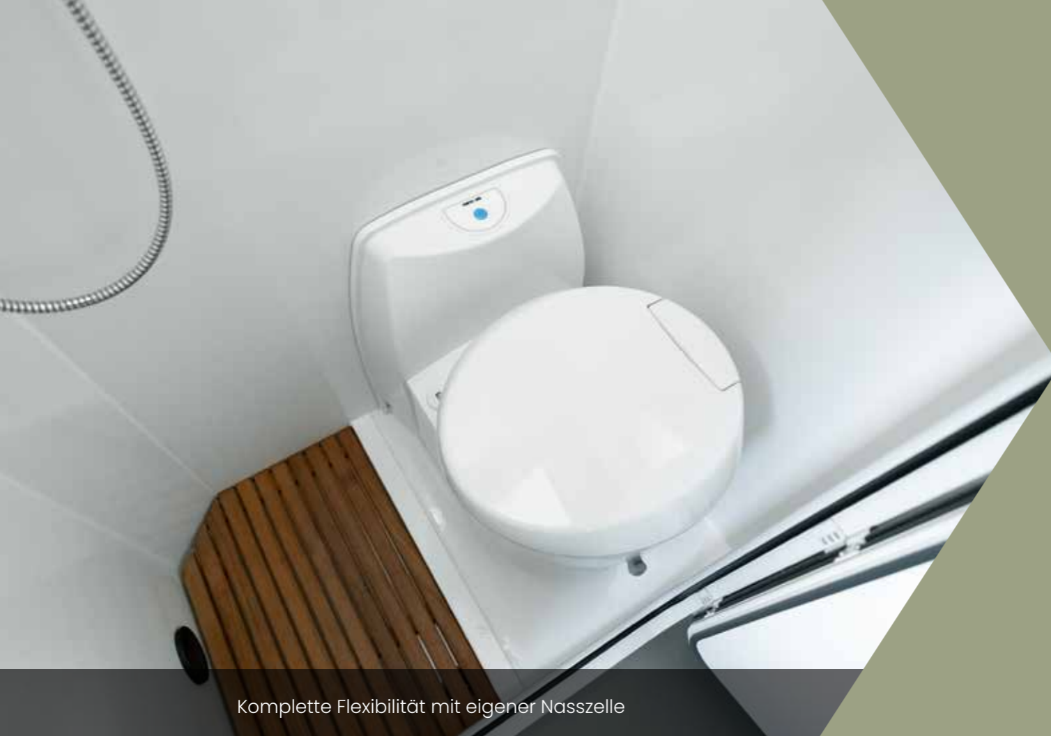
Komplette Flexibilität mit eigener Nasszelle