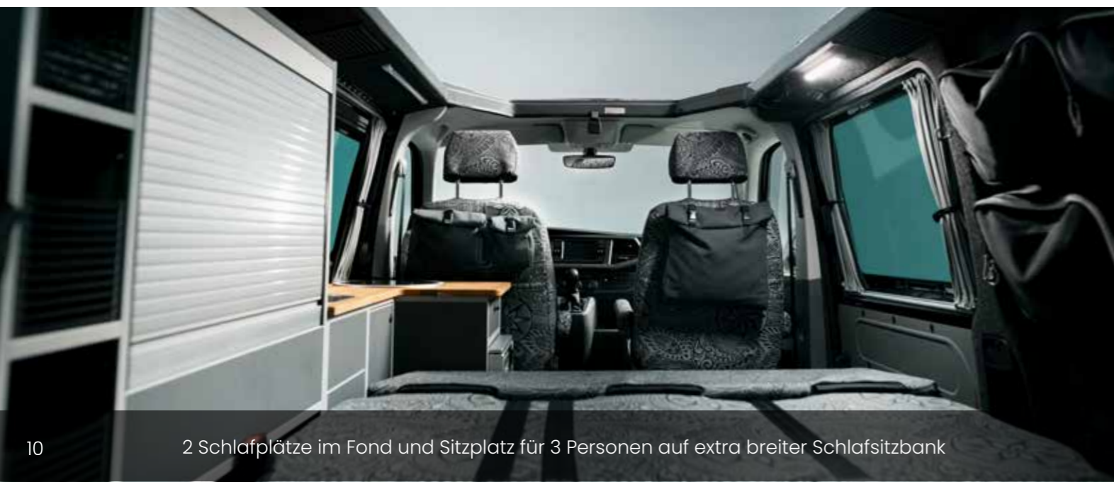
2 Schlafplätze im Fond und Sitzplatz für 3 Personen auf extra breiter Schlafsitzbank