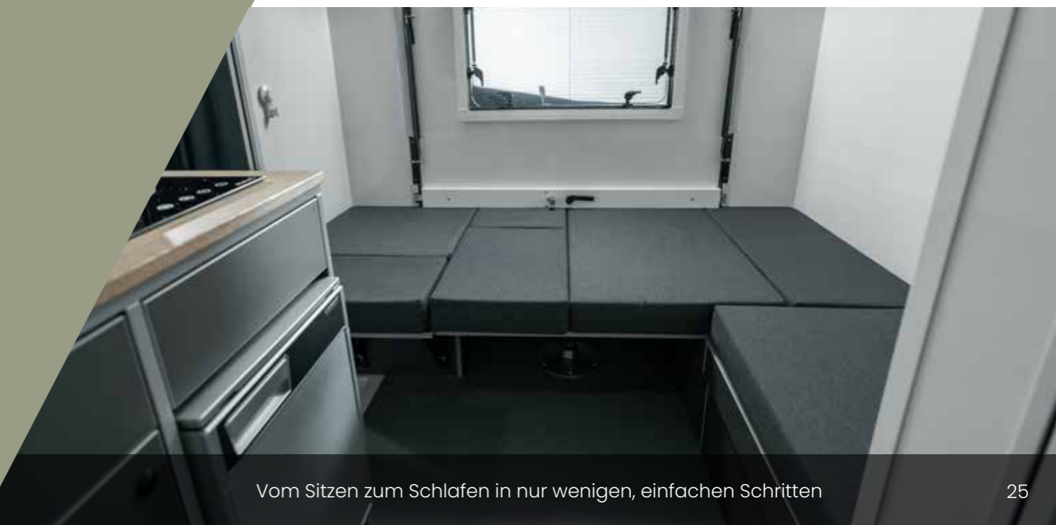
Vom Sitzen zum Schlafen in nur wenigen, einfachen Schritten