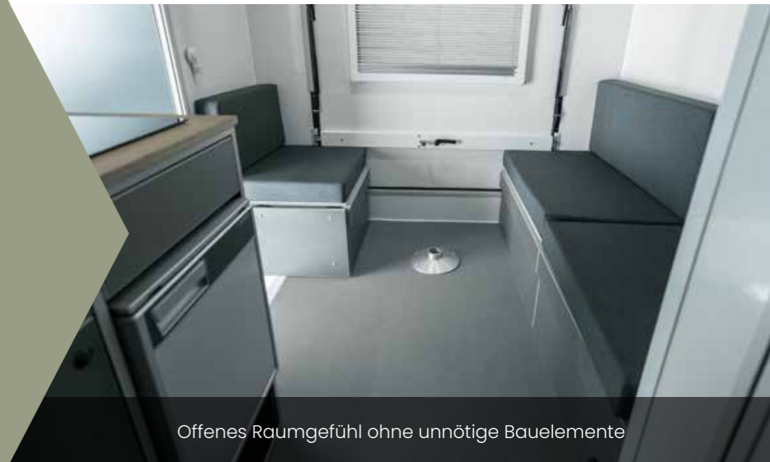
Offenes Raumgefühl ohne unnötige Bauelemente

Wohn-, Ess- und Schlafzimmer in einem: Die travelboxx schafft durch ihr klares Raumkonzept ein einzigartiges, gigantisches Raumgefühl, das sich durch die Panorama-Heckklappe sogar nach außen öffnen lässt. Das fahrende Zuhause überzeugt mit viel flexiblem Stauraum, wenig Schickschnack und einem Umbau in wenigen, einfachen Handgriffen!