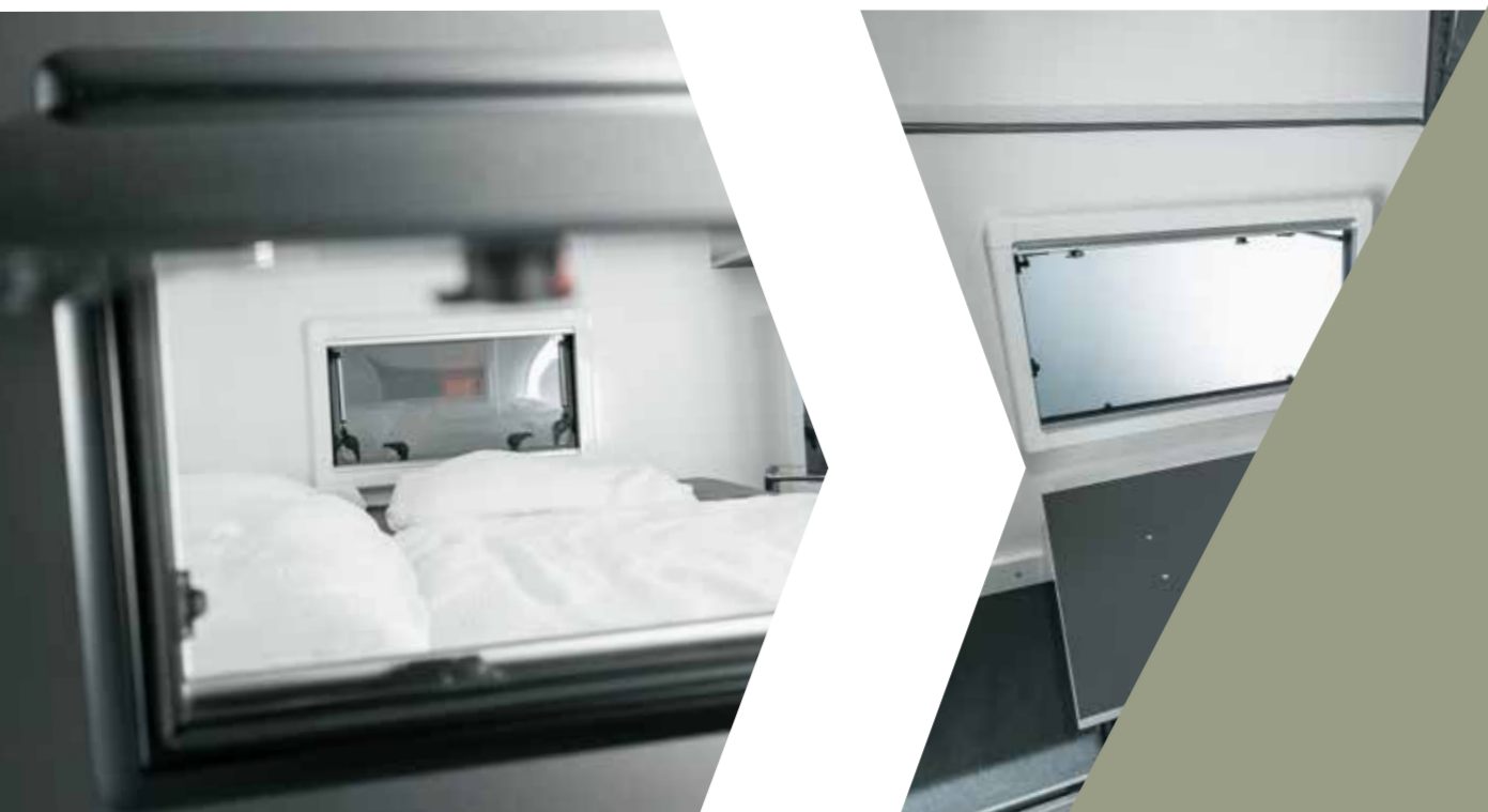
Doppelbett für 2 Personen