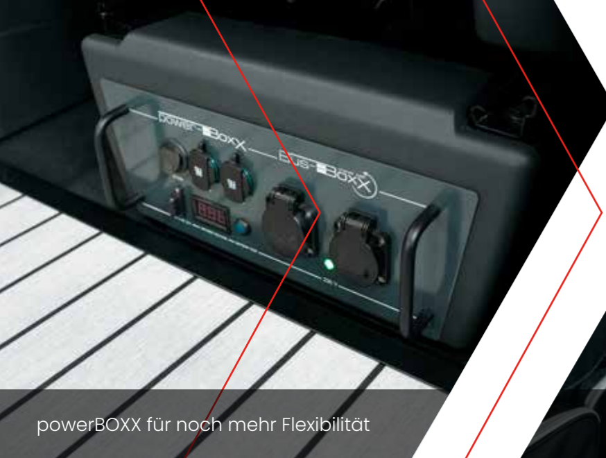
powerBOXX für noch mehr Flexibilität