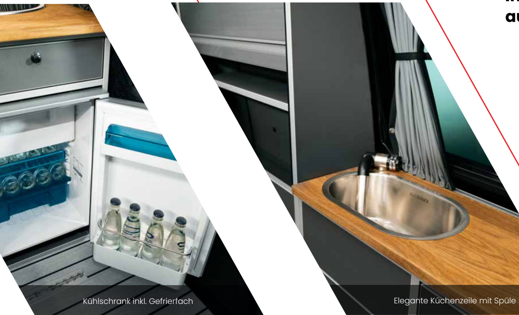
Kühlschrank inkl. Gefrierfach