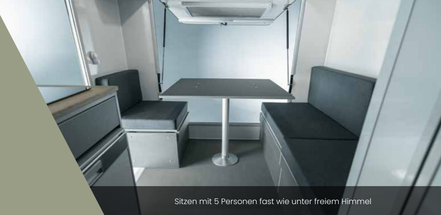
Sitzen mit 5 Personen fast wie unter freiem Himmel