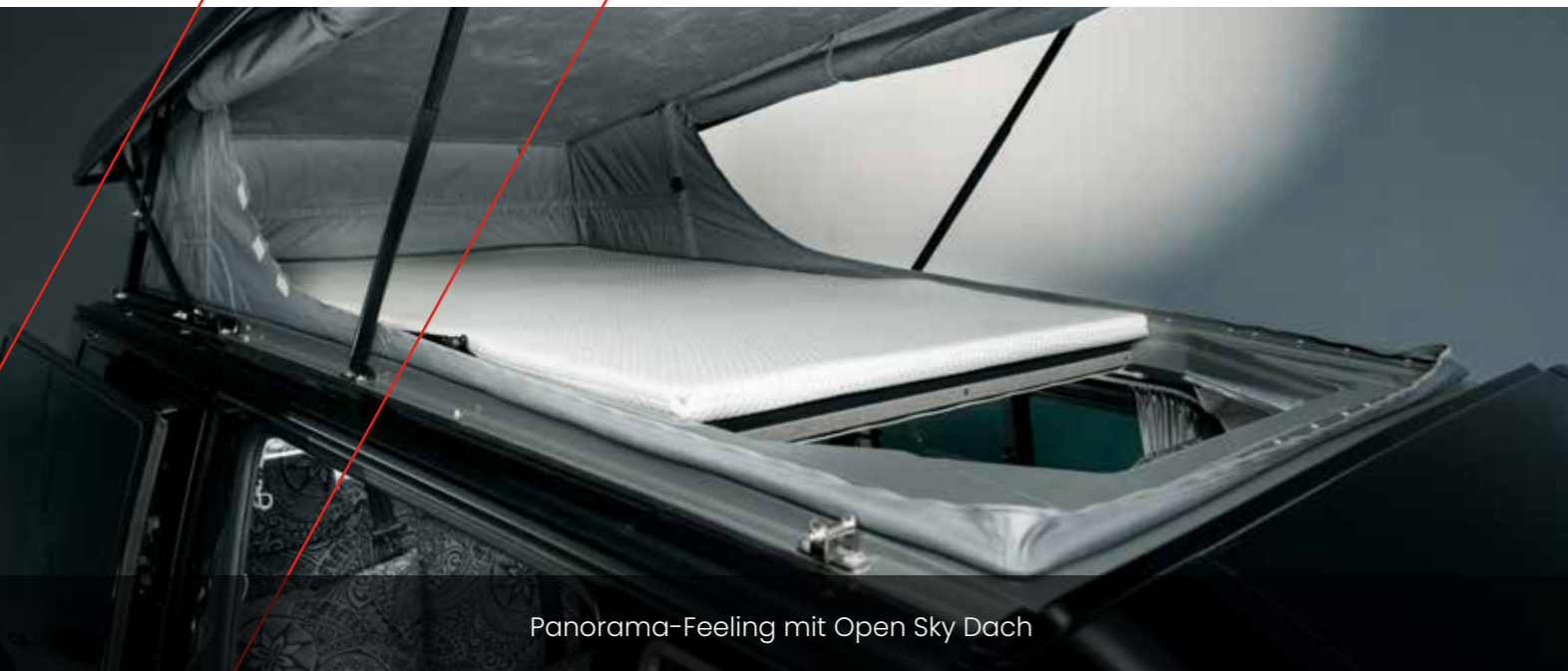
Panorama-Feeling mit Open Sky Dach