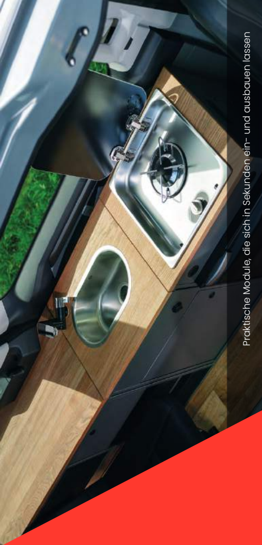
Praktische Module, die sich in Sekunden ein- und ausbauen lassen