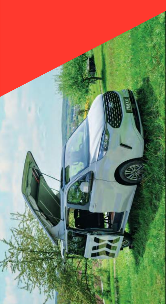
Komfort Plus – Schiebetüren auf Fahrer- und Beifahrerseite