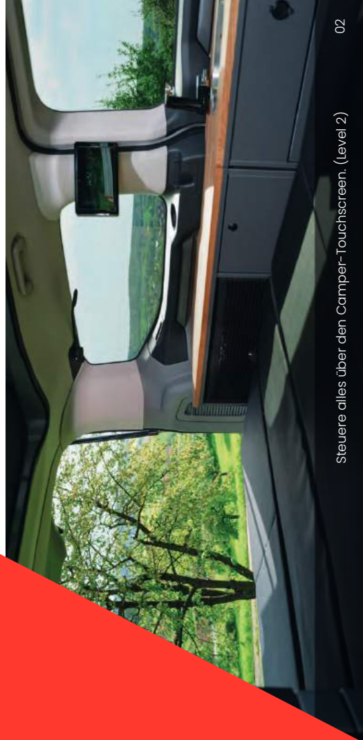
Steuere alles über den Camper-Touchscreen. (Level 2)