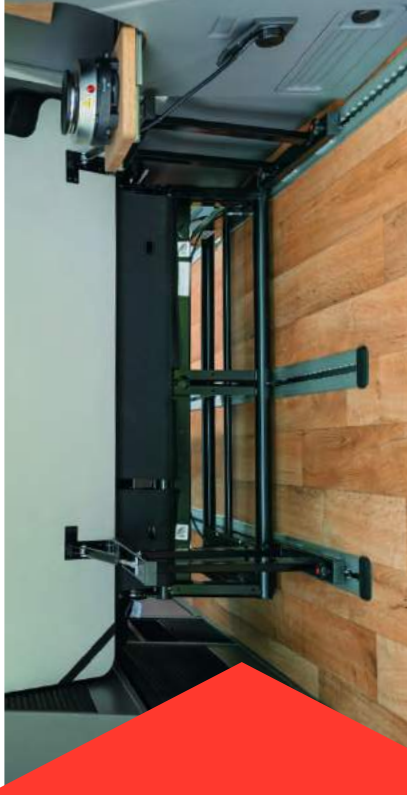
Campingzulassung dank Kochfeld und Stauraum im Heck