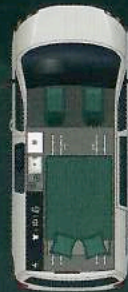
Nacht 114 x 187 cm