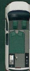
Nacht 114 x 187 cm