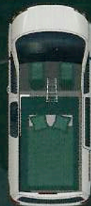
Pop up 120 x 200 cm